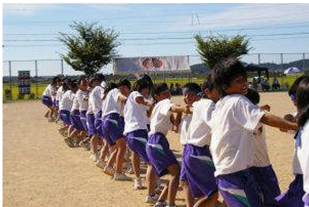
〈全員の力を結集した綱引き〉