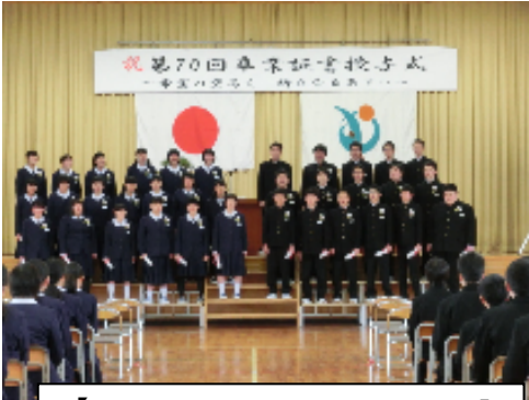
【3月3日 卒業証書授与式】

3月24日をもって平成28年度が終了しました。授業日数は206日でした。4月6日の1学期始業式から3月24日の3学期終業式まで、学校行事を含む様々な教育活動を充実させて展開することができ、生徒たちも活動を通じて大きく成長してくれました。また、創立70周年の記念行事も滞りなく実施することができました。これらは保護者の皆様や地域の皆様からの御理解と御協力のおかげだと改めて感じております。感謝申し上げます。一年間、多くの活動において力強い御支援をいただき、大変ありがとうございました。職員が毎日記録している「日番日誌」から、3月の平中生のすばらしい姿を紹介します。