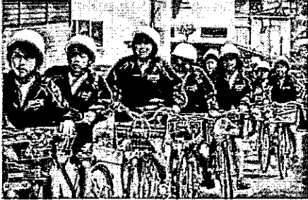
浜まで自転車で大移動