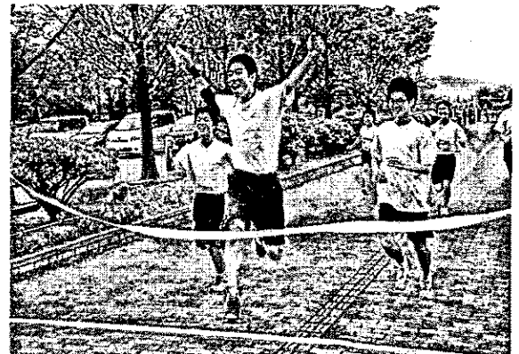
【5月10日 駅伝マラソン大会のゴール】