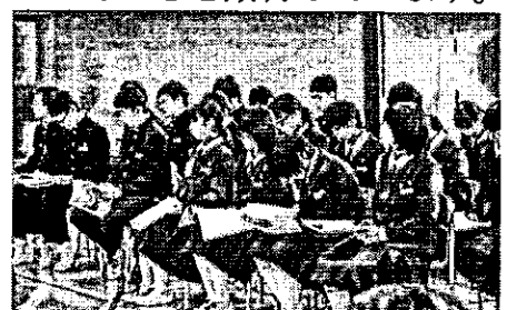
答弁にもよく耳を傾けていました