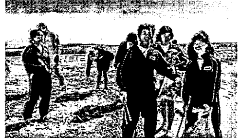
作業するうちに笑顔もこぼれました