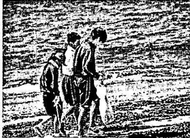
少し肌寒くはありましたが...