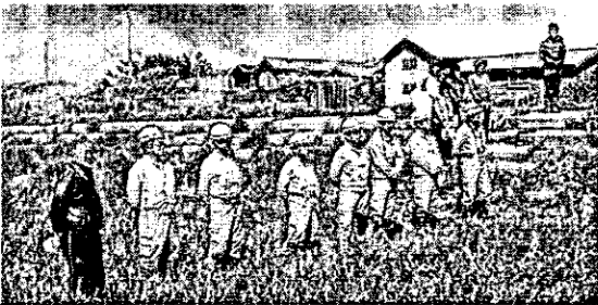
保護者、地域の方からもご協力いただきました