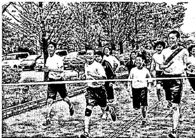
【駅伝マラソン大会 最後のゴール】

○体力テストがありました。どの生徒も各種目の測定担当の先生に、あいさつ等、礼儀正しく接し、一生懸命に各種目に取り組んでいて、感心しました。(5月12日)