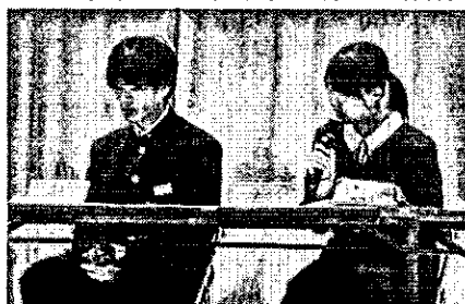
議長団による落ち着いた議事進行