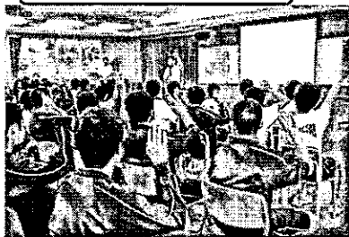
3日「命の大切さを考える集会」