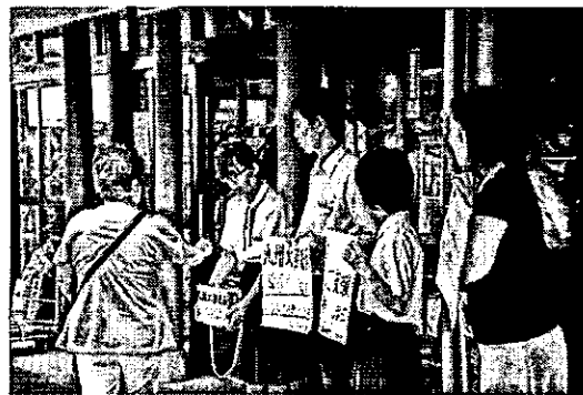
【7月15日 生徒会による募金活動】

さて、7月15日(土)に、生徒会執行部の生徒が「道の駅神林」で、今回の「九州北部豪雨の募金活動」を行いました。被災した人たちを支援しようと、自分たちにできることを考え、これまでの感謝の気持ちや地域へ貢献する気持ちをもって取り組みました。そして多くの人から温かい気持ちのこもった募金をいただくことができました。