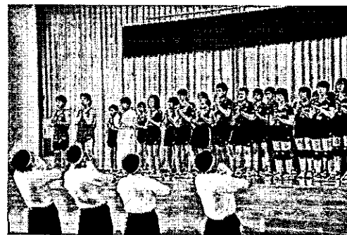
【6月26日 下越地区大会激励会】

保護者の皆様や地域の皆様からは、1学期の教育活動へのご協力とご支援を頂き、無事すべての教育活動を終えることができました。感謝申し上げます。