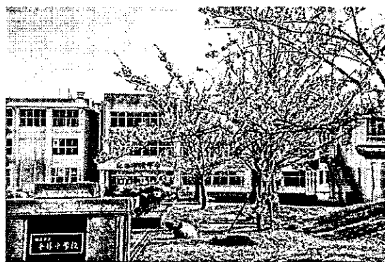
【4月12日 満開になった桜】

さらに、平中では、年間をⅠ～Ⅵ期に分けて目標を設定し、教育活動を行っていきます。各期の目標が達成されるように、学習活動・学級活動・生徒会活動・部活動・学校行事など、それぞれの活動で目標を意識して、工夫して取り組んでいきます。期の目標は、生徒玄関に掲示し、全校生徒が意識して学校生活を送っていきます。