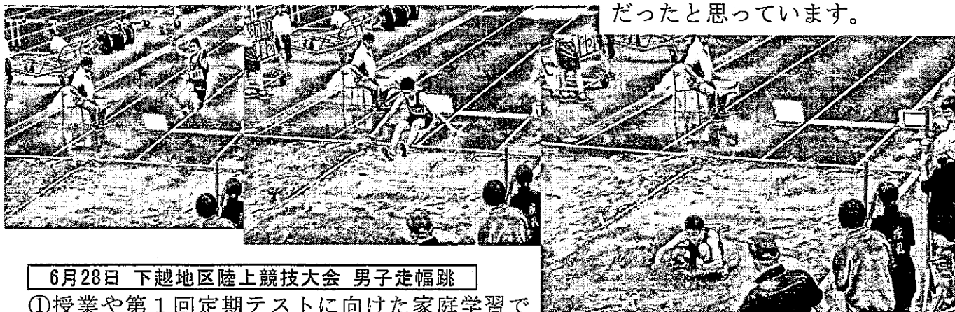
6月28日 下越地区陸上競技大会 男子走幅跳

私は、閉校を迎える今年度の始業式で「有終の美を飾る年度となれるように、一つ一つの教育活動を充実させていきましょう」と話しました。1学期を振り返ってみると、生徒の皆さんが落ち着いた態度で学校生活を送り、目標をもって諸活動に取り組んでいた学期だったと思っています。