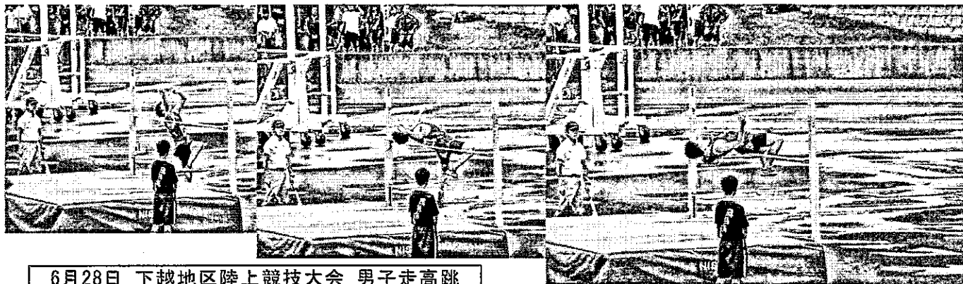
6月28日 下越地区陸上競技大会 男子走高跳

本日をもって平成30年度1学期が終了しました。授業日数は74日(1年生は73日)でした。